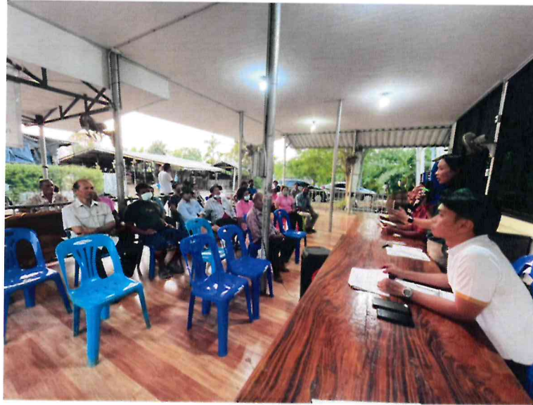
ประชุมประชาคมท้องถิ่น (ระดับหมู่บ้าน) ประจำปีงบประมาณ พ.ศ. ๒๕๖๗ ณ ศาลาอเนกประสงค์ประจำหมู่บ้าน หมู่ที่ ๑๓ บ้านหนองเตาปูน วันที่ ๒๗ กุมภาพันธ์ ๒๕๖๗